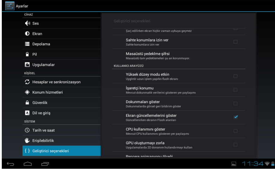
Şekil 3. Tablet ekranının flaşlamasının düzeltilmesi.

Tablet ekranına dokunulduğunda karşılaşılan flaşlama ile ilgili tablet ayarlarındaki “Ekran Güncellemelerini Göster” seçeneğinin işaretli olmadığından emin olunmalıdır.